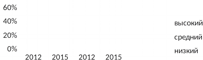
Рис.2 Динамика позитивных изменений в познавательных и практических умениях

объекта и потребностью, которая не удовлетворена. Дети выделяют предмет труда, его особенности, значимые для предстоящего процесса ухода; способны предвидеть результат, умеют отбирать оборудование для осуществления деятельности, владеют практическими умениями деятельности в природе (уход, выращивание растения), умеют соотносить результат труда с целью. Динамика позитивных изменений в познавательных и практических умениях представлена в диаграмме: