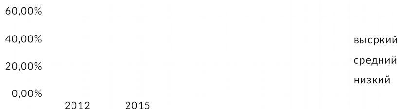
Рис. 1. Динамика уровня экологических знаний.

Анализ результатов опытной работы показал, что у детей произошли значительные позитивные изменения в познавательных и практических умениях. Дети анализируют состояние живого существа. Выделяют значимые для деятельности свойства и качества объекта природы. Дошкольники способны видеть зависимость между состоянием живого