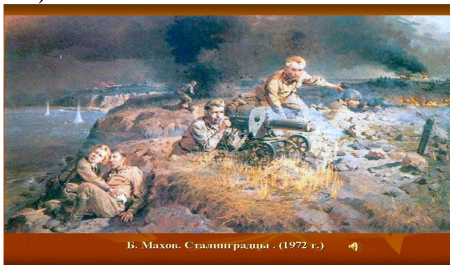
Б. Махов. Сталинградцы. (1972 г.)

«22 июня 1941 года в 4 часа утра без объявления войны, германские войска напали на нашу Родину», была остановлена мирная жизнь народа. Началась Великая Отечественная война. Война разрушила судьбы миллионов людей. Весь народ встал на защиту Родины, (слайд №1)