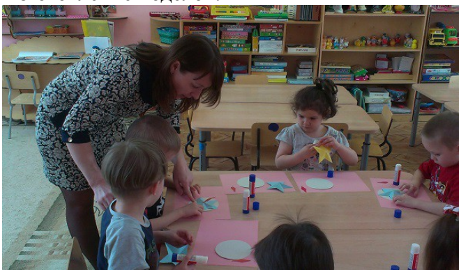
Изготовление «Вечного огня»