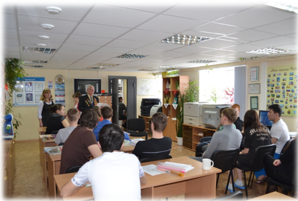
Организация выездных интервью