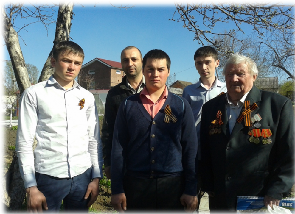
Круглые столы, беседы